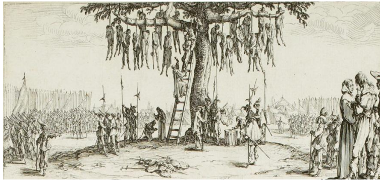
3. Jacques Callot, La pendaison (1633).

Ainsi Henry V incarne-t-il un idéal militaire fait roi en conformité à nouveau avec les règles de Dudley et d'Essex : il veille à ce que la discipline règne sur le champ de bataille, en dépit des amitiés passées. Incidemment, on trouve de nombreuses estampes tardives, puisque publiées en 1633, de Jacques Callot, mais intitulées Les Misères et les Malheurs de la Guerre , qui représentent la « soldatesque » — déjà présente sur le plateau du théâtre shakespearien — et les pendants de soldats vivant de rapines, autrement dit enfreignant les « disciplines de la guerre », si précieuses à Henry V et à son capitaine Fluellen :