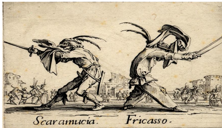
4. Jacques Callot, Balli di Stessania, Scaramucia — Fricasso (1621-1622).