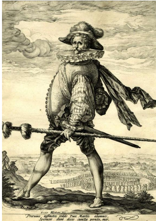
1. Hendrik Goltzius, The Captain of Infantry (1587).

« disciplines de la guerre », reflète un idéal soldatesque, comme en témoigne la légende latine accompagnant l'estampe : « Præuius infractos reddo Dux Martis alumnos, / Spernere dum doceo cuncta pericla, meo », que l'on pourrait traduire par « Moi, capitaine de l'armée, je rends mes disciples invincibles, je circule pour leur enseigner à conjurer tous les dangers ». De fait, on peut voir un impeccable « déroulement », au sens propre du terme, de manœuvres en arrière-plan :